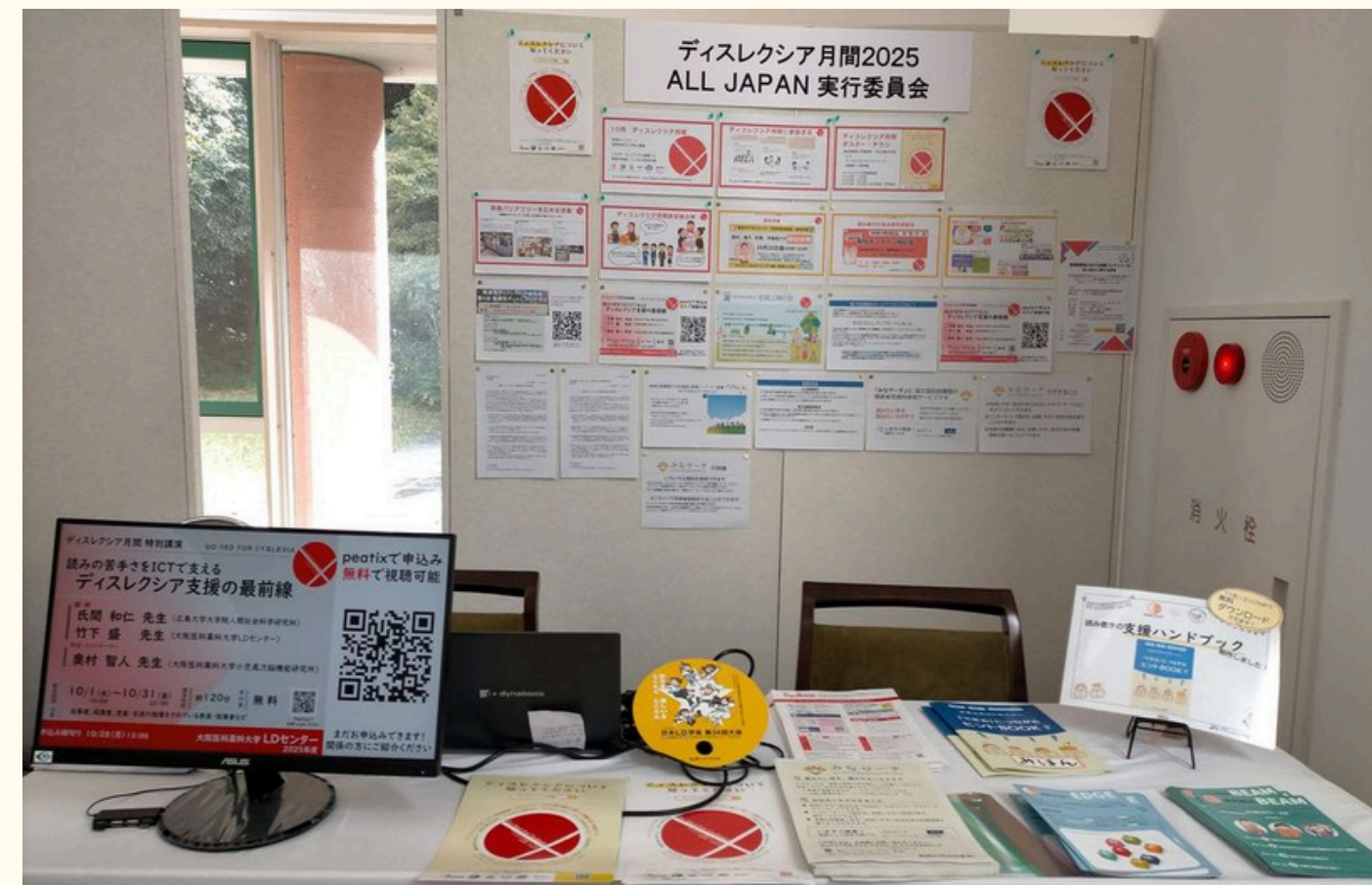
LD学会ディスレクシア月間実行委員会ブース