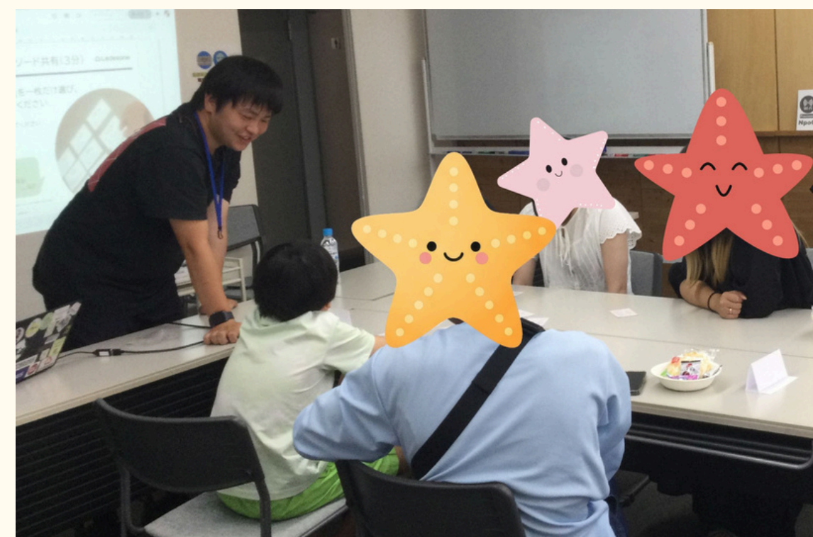
生成AIワークショップ