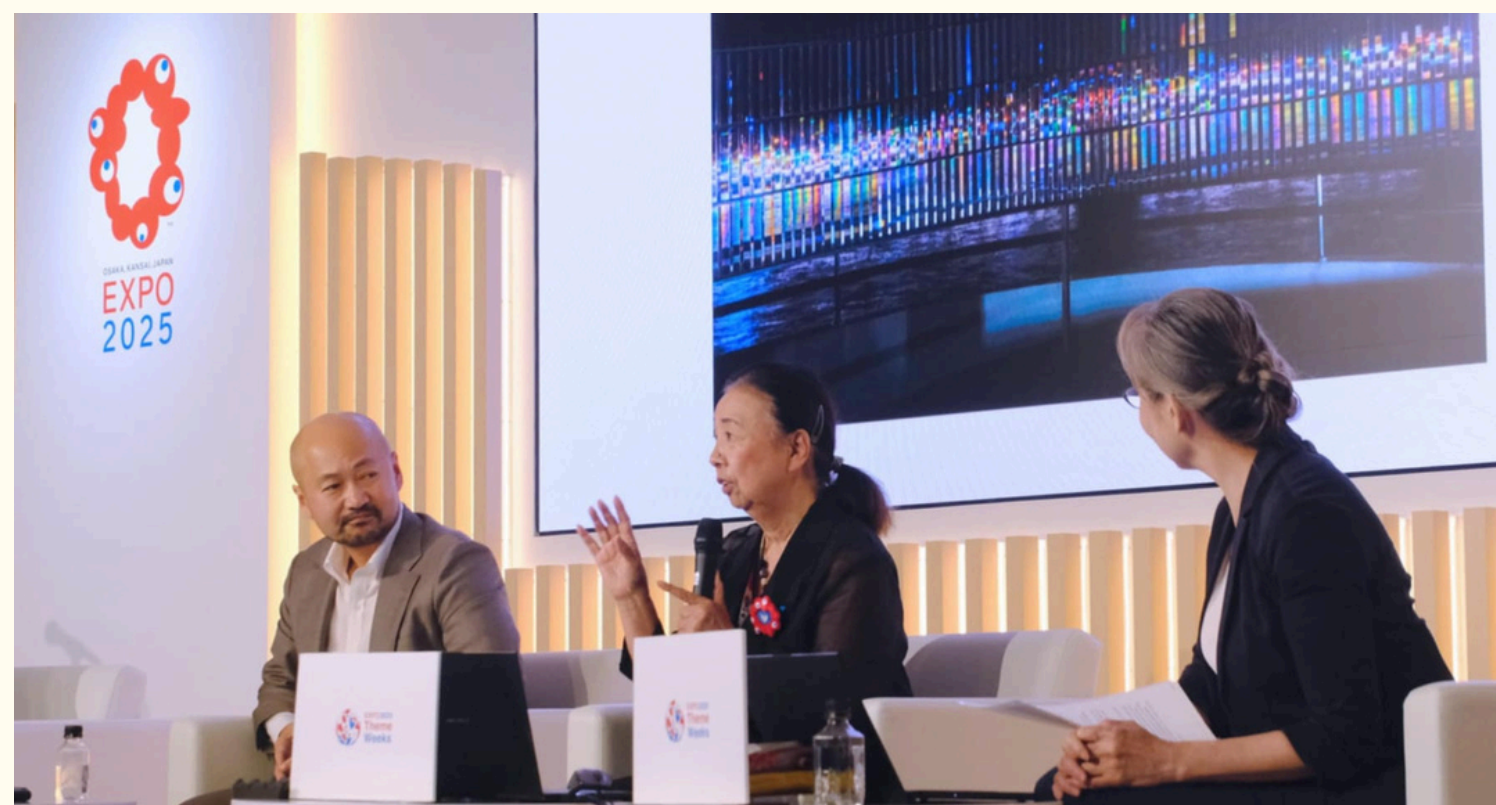
大阪万博パネリスト登壇