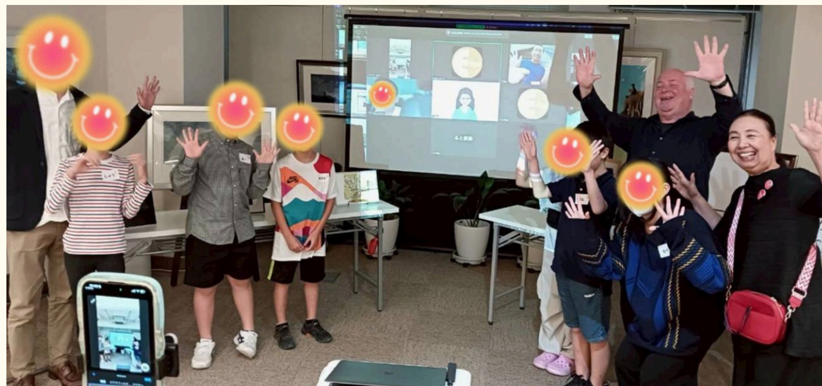
アートコンペティション表彰式